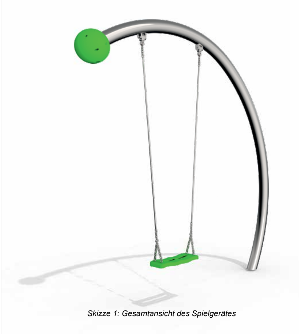
Skizze 1: Gesamtansicht des Spielgerätes