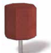
mit Bodenanker Art.-Nr. 2565000109

Das Terrasoft Polygon findet seinen Einsatz in zahlreichen Gebieten: ob als Begrenzungselement für Einfahrten und Wege oder als Sitzgelegenheit zum Beispiel an Sandkästen. Unterschiedliche Farben regen hierbei phantasievolles Spielen der Kinder an. Für noch mehr Gestaltungsvariationen ist das Polygon auch in EPDM-Farben erhältlich (siehe Seite 168).