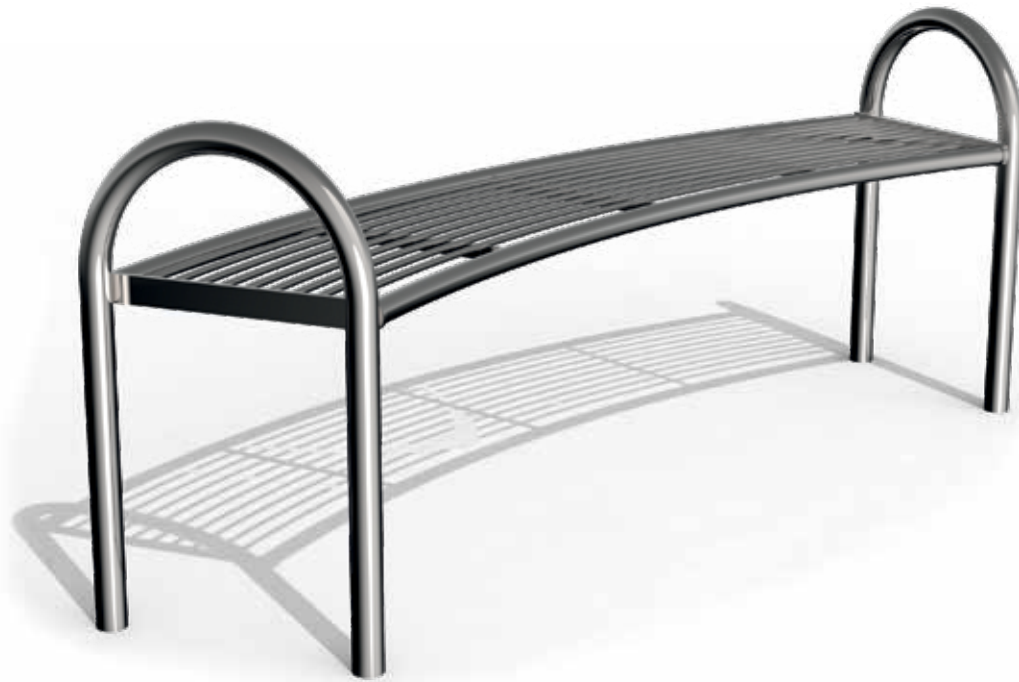
Skizze 1: Gesamtansicht