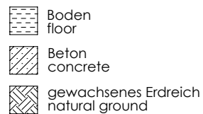
Skizze 2: Fundamentplan