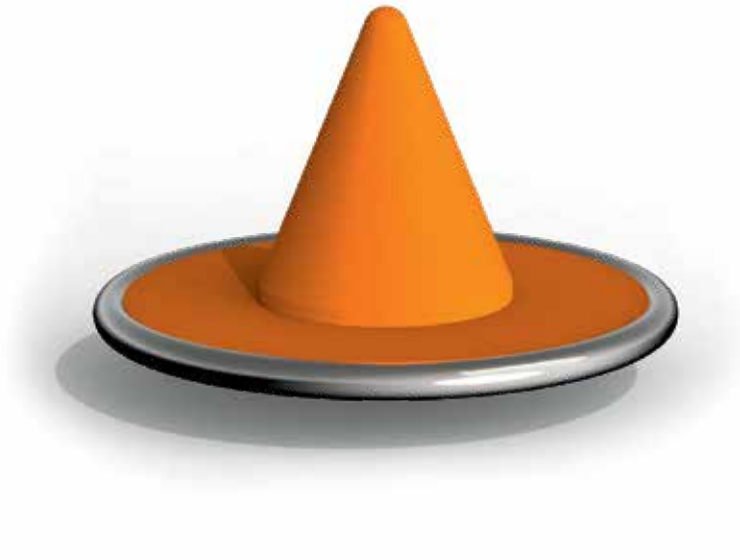
Skizze 1: Gesamtansicht des Spielgerätes