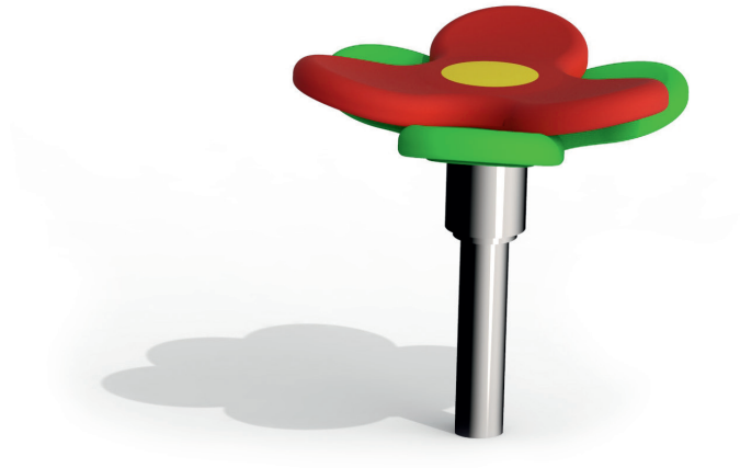
Skizze 1: Gesamtansicht des Spielgerätes