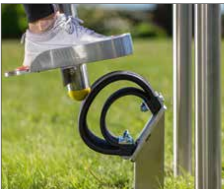
Funktionsweise des 2-Phasen-Wippendämpfers:

Der Terrasoft Wippendämpfer kann auch als stoßdämpfendes Element direkt am Wippengestell montiert werden.