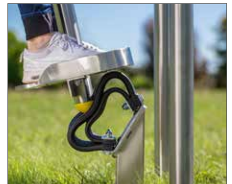
Der innere Ring sorgt für Stabilität und eine weiche Aufschlagdämpfung.