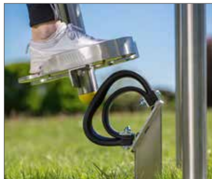
Der äußere Ring entschleunigt den ersten Aufprall der Wippe.