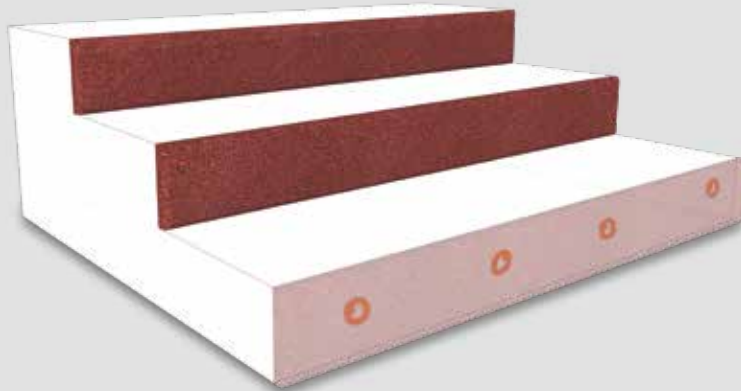
Verklebung der Terrasoft Treppenstoßkante auf vorhandenen Stufenanlagen